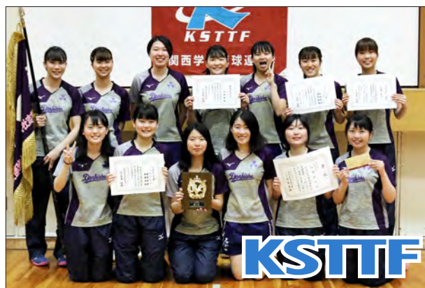
女子1部校3位 同志社大