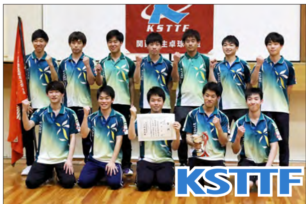
男子2部校優勝 神戸大