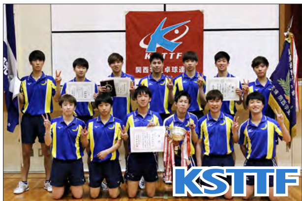
男子1部校優勝 関西学院大