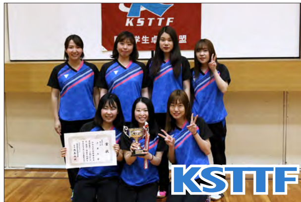
女子2部校優勝 芦屋大