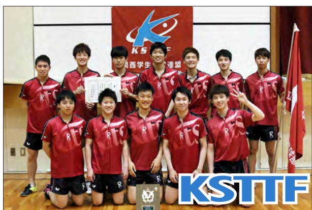
男子1部校2位 立命館大