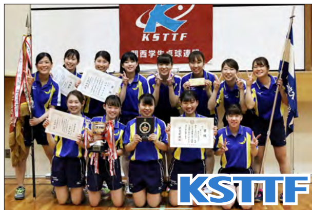
女子1部校優勝 関西学院大