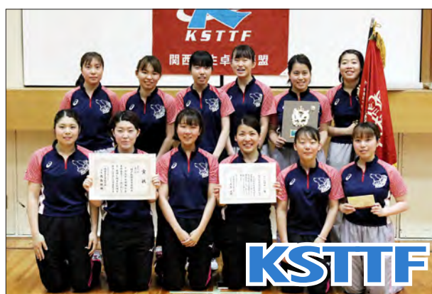
女子1部校2位 神戸松蔭女子学院大