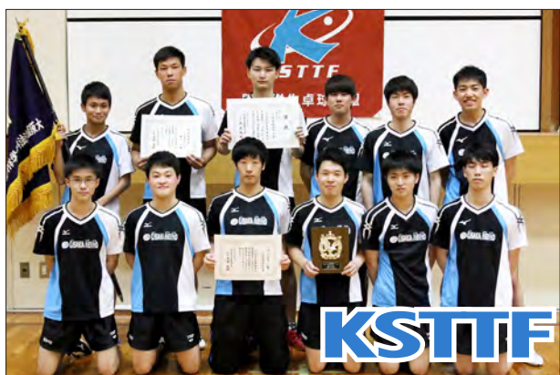
男子1部校3位 大阪経済法科大