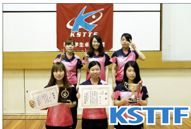
女子2部優勝 芦屋大学