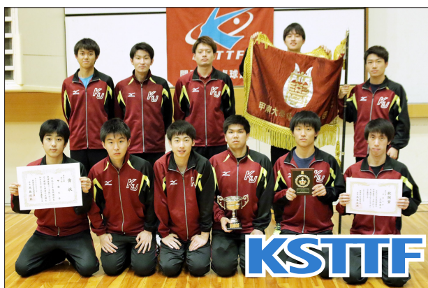
男子2部優勝 甲南大学