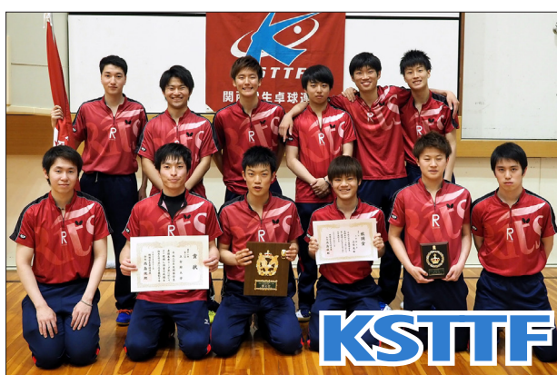
男子1部2位 立命館大学