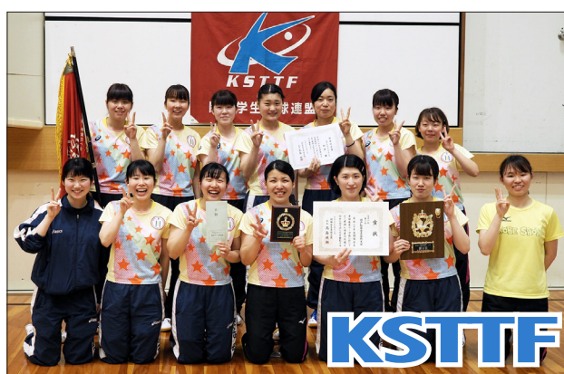
女子1部2位 神戸松蔭女子学院大学