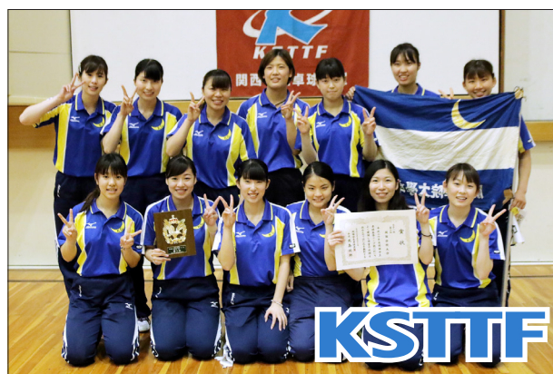
女子1部3位 関西学院大学