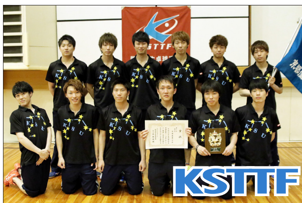
男子1部3位 京都産業大学