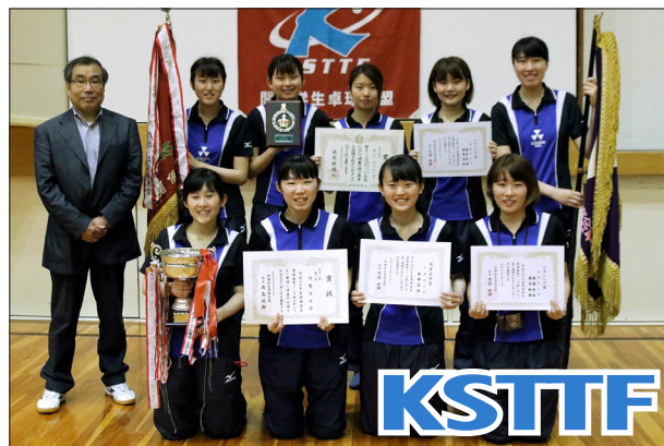
女子1部優勝 同志社大学