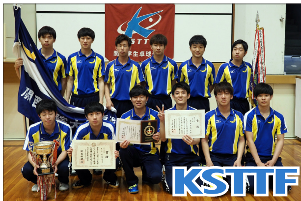
男子1部優勝 関西学院大学