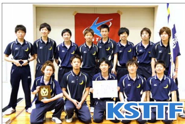
男子 1 部 3 位 関西学院大