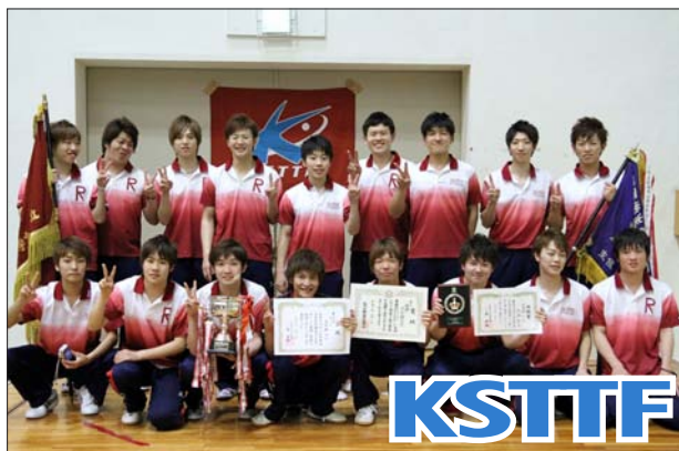
男子 1 部優勝 立命館大