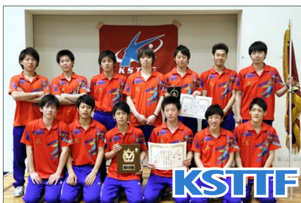
男子 1 部 2 位 近畿大