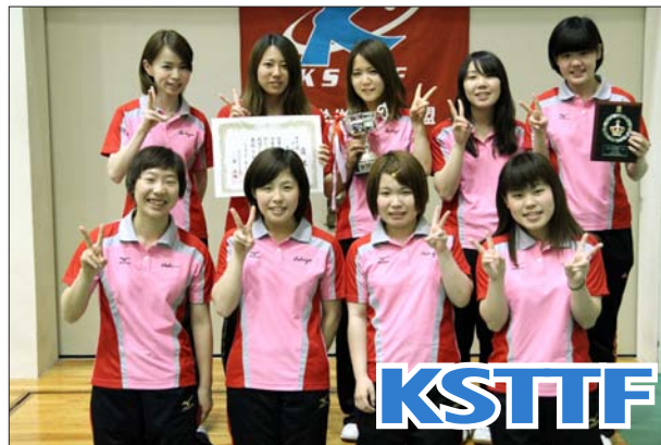
女子 2 部優勝 芦屋大