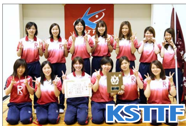
女子 1 部 2 位 立命館大