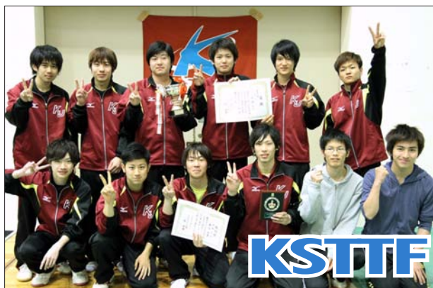
男子 2 部優勝 甲南大