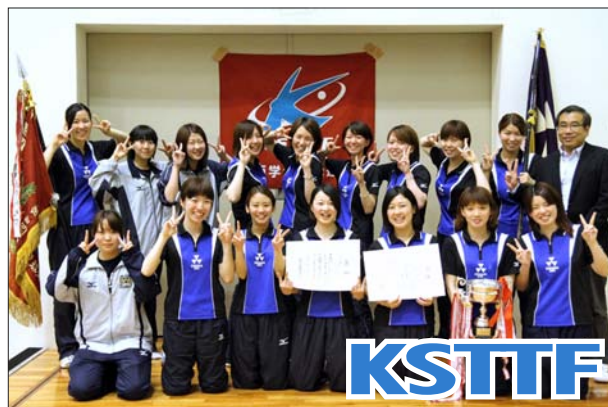
女子 1 部優勝 同志社大