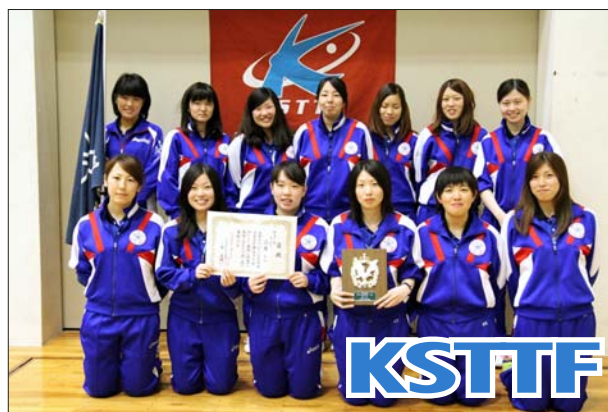
女子 1 部 3 位 近畿大