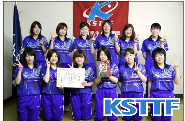
女子 1 部 3 位 近畿大