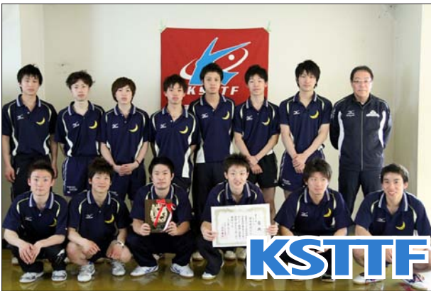
男子 1 部 3 位 関西学院大