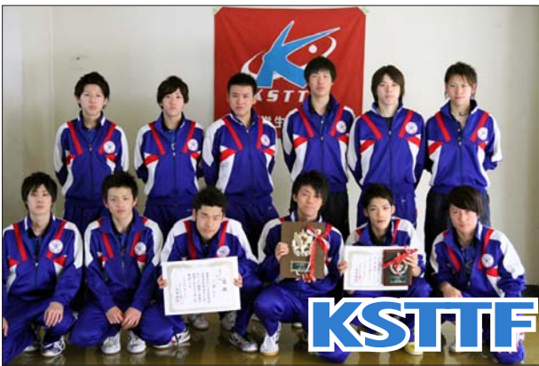
男子 1 部 2 位 近畿大