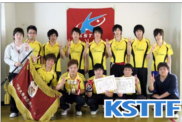
男子 2 部優勝 甲南大