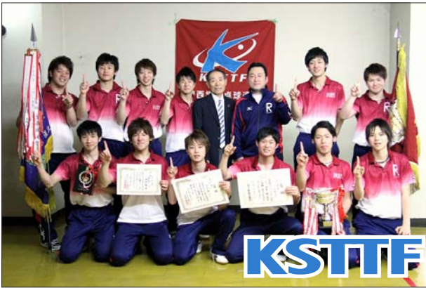
男子 1 部優勝 立命館大