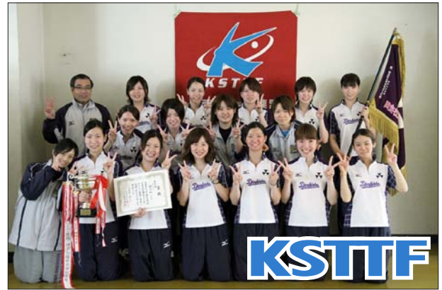
女子 1 部優勝 同志社大