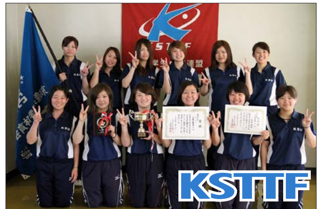
女子 2 部優勝 京都産業大