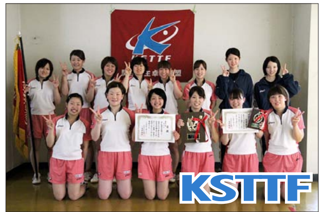
女子 1 部 2 位 神戸松蔭女子学院大