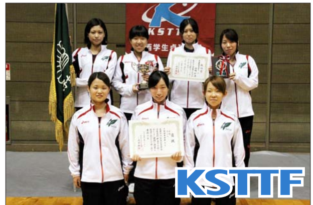
女子 2 部優勝 大阪樟蔭女子大大