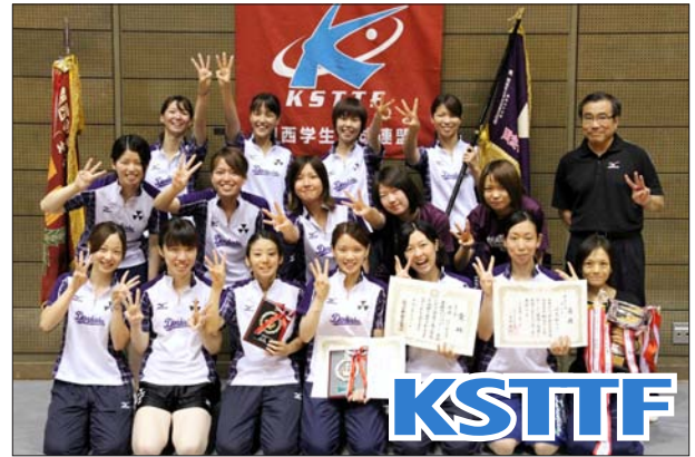
女子 1 部優勝 同志社大