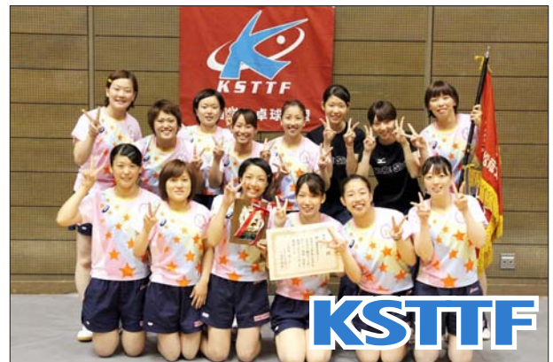
女子 1 部 3 位 神戸松蔭女子学院大