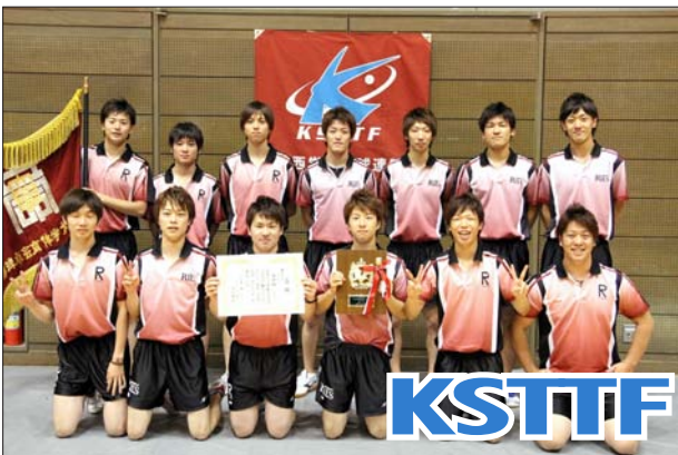
男子 1 部 2 位 立命館大