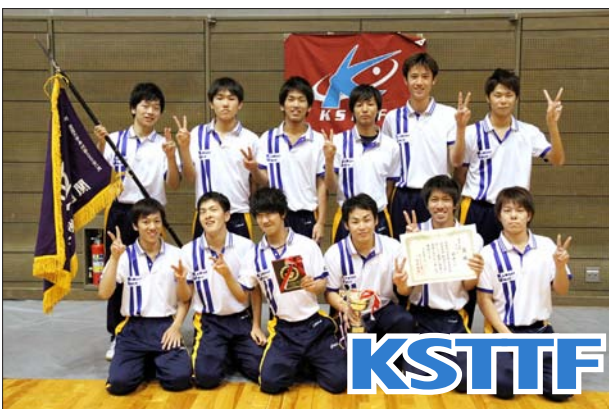
男子 2 部優勝 関西大