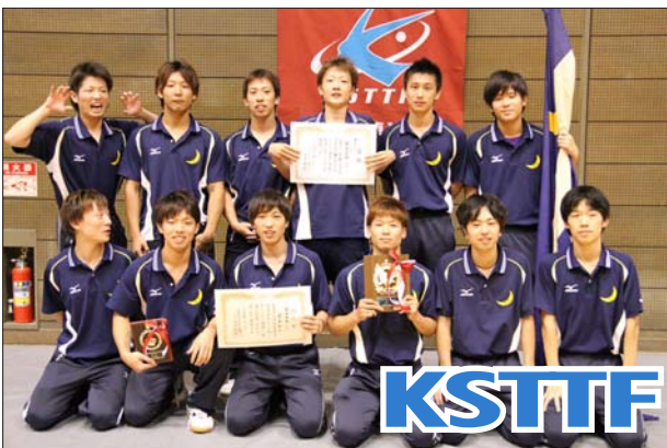
男子 1 部 3 位 関西学院大