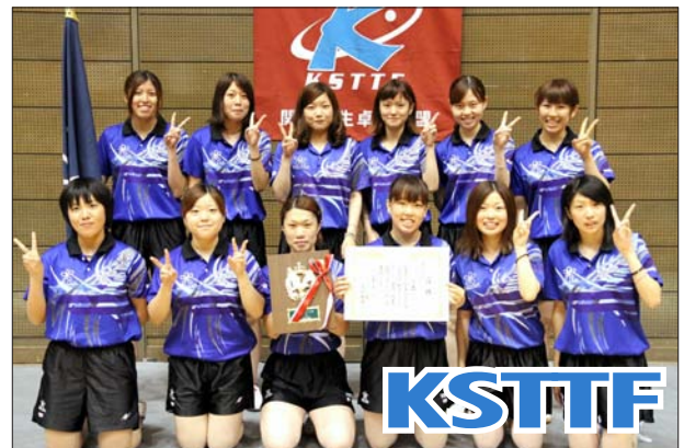
女子 1 部 2 位 近畿大