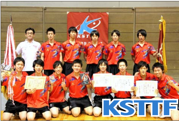
男子 1 部優勝 近畿大